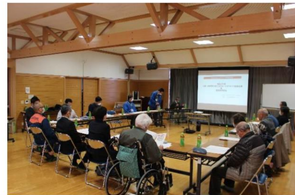
被災者生活サポートボラネット推進会議の開催