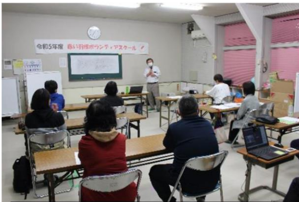
赤い羽根ボランティアスクールの開講