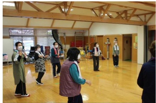
健康増進事業としてストレッチ教室の開催