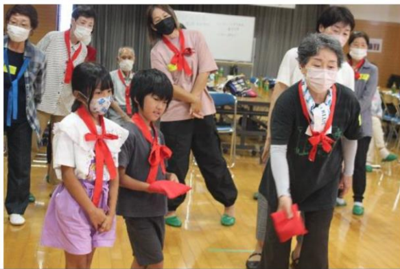
木江サロンと木江小学校との交流会を開催